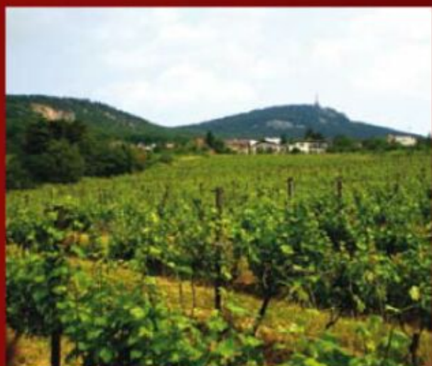
Vinice na Zobore

To, že táto cesta je správna, potvrdzuje každoročný nárast produkcie i ocenenia z domácich a zahraničných výstav vín.